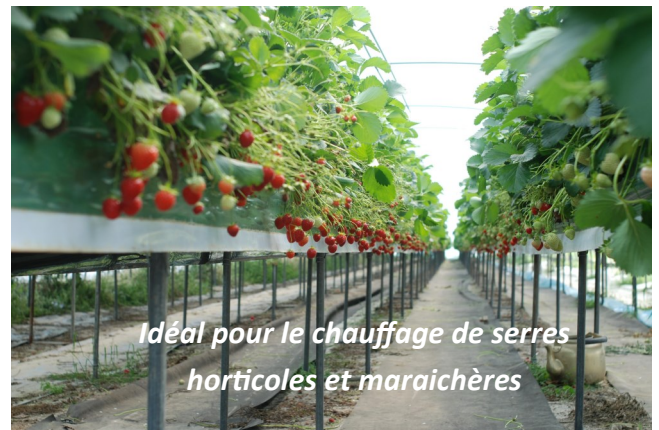
Idéal pour le chauffage de serres horticoles et maraichères