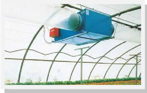
Installation fixe suspendue ou au sol Chauffage par gaine polyanne permettant une parfaite répartition de l'air chaud en serre