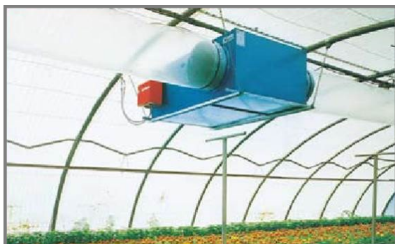
Installation fixe suspendue ou au sol