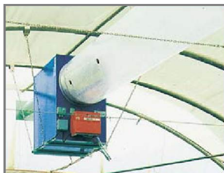
Chauffage par gaine polyane permettant une parfaite répartition de l'air chaud en serre

Les générateurs d'air chaud de la gamme AGRI-P sont spécialement conçus pour le domaine agricole . Ils permettent de distribuer l'air en vrac ou à travers un réseau de gaines. Le modèle de ventilateur hélicoïde AGRI-P est hautement performant et l'encombrement est minimum. Il se fixe au sol ou peut être suspendu. Le générateur AGRI hélicoïde s'installe en position verticale ou horizontale. Il est disponible en version fuel ou gaz .