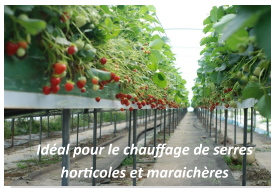
Idéal pour le chauffage de serres horticoles et maraichères

Audit thermique, études techniques, solutions en chauffage de serres et en gestion du climat