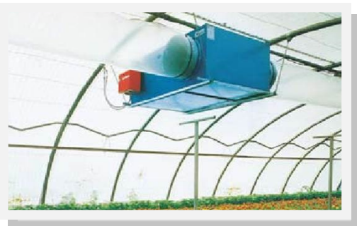
Chauffage par gaine polyane permettant une parfaite répartition de l'air chaud en serre