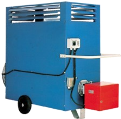
Générateur mobile sur roues, soufflage direct, à gaz ou à fuel.