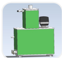
Modèle MC 200